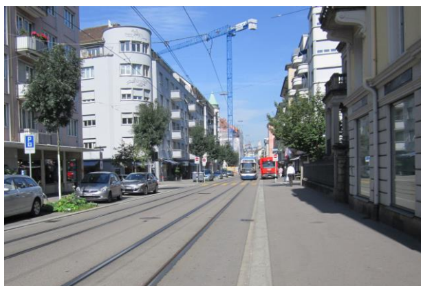
Klare Geometrien / Breite Randsteine / Ordnende Baumreihen