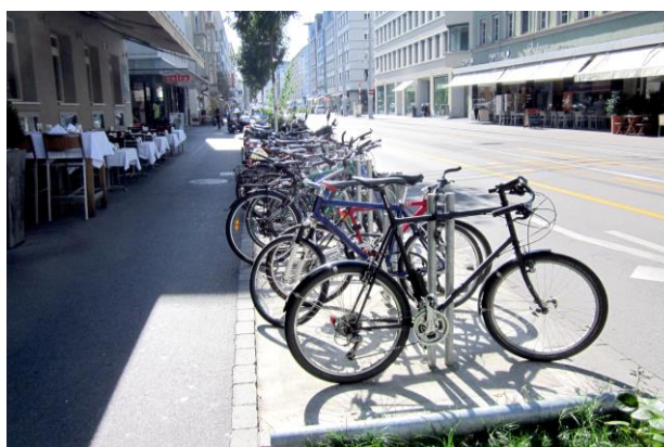
Elementbänder mit Parkierung / Bepflanzung / Anlieferung