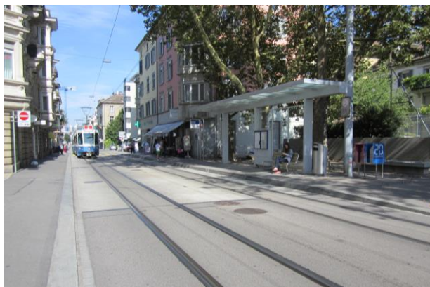
Behindertengerechte Gestaltung der Bus-/Tramhaltestellen